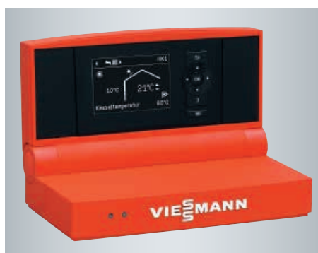
Régulation Vitotronic avec menu déroulant clairement structuré